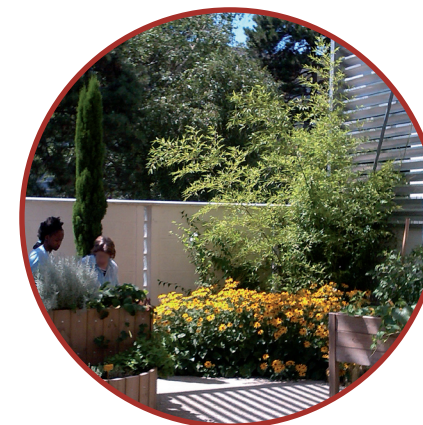
le jardin thérapeutique